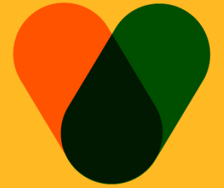
Tableau de vision et de mission