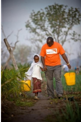
Figure 1 Un membre de notre équipe du Mali

Vision du Monde est une association de solidarité internationale – (loi 1901, non-confessionnelle, reconnue d'intérêt général) - membre du réseau World Vision, qui vient en aide aux enfants les plus vulnérables . Inspirée par les valeurs chrétiennes, sa vision est celle d'un monde plus juste, où chaque enfant peut grandir en paix, manger à sa faim, être aimé et vivre pleinement sa vie.