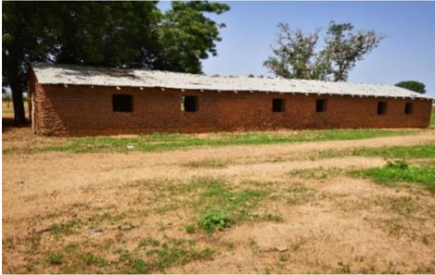
Figure 5 : Ecole primaire de Lahandi : bloc construit en banco

Créée en 1981, l'école Fondamentale de premier cycle de Lahandi relève de l'Académie d'Enseignement (AE) de Kita, du Centre D'Animation Pédagogique (CAP) de Bafoulabé. Les locaux du premier cycle d'enseignement fondamental 5 comptent six salles de classe dont un bloc de trois salles construit en banco (terre crue) sur l'initiative des populations. L'autre bloc de trois salles de