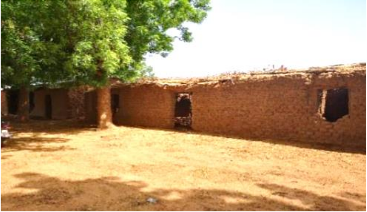
Figure 10 Etat actuel du bloc en banco construit par la communauté

Cette situation démontre le besoin de mettre en œuvre un projet intégré afin de garantir l'accès à un environnement scolaire sain et inclusif, prenant en compte trois dimensions : l'accès à l'eau, l'accès à des infrastructures sanitaires et l'accès à des infrastructures scolaires équipées et inclusives.