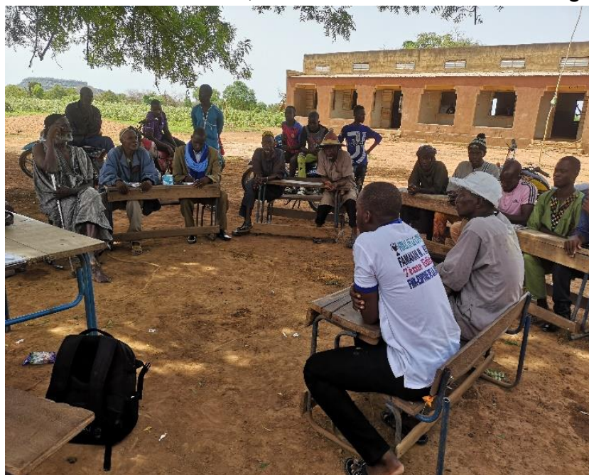
Figure 7 Rencontre avec les membres de la communauté de Lahandi

Tout d'abord, les infrastructures qui ont été construites par la communauté, c'est-à-dire un bloc de 3 salles de classe en banco, sont dans un état extrêmement dégradé . En effet, certaines portions de murs sont détruites.