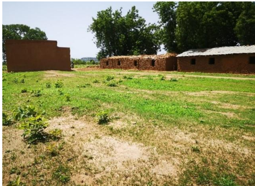
Figure 6 Ecole primaire de Lahandi : bloc construit en dur.

Sur les 31 villages composant la commune de Koundian, seuls 19 disposent d'infrastructures éducatives, dont le village de Lahandi. L'école de premier cycle de Lahandi accueille les enfants du village, mais aussi ceux des 4 villages voisins, situés entre 3 et 5 kms de distance.