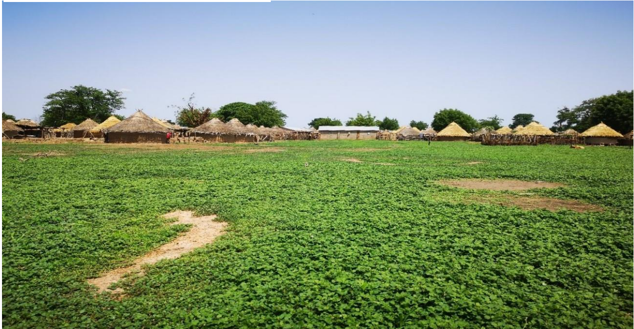
Figure 3. Village de Lahandi

Le village de Lahandi est l'un des plus gros de la commune de Koundian, avec 1.122 habitants dont 578 femmes et 543 hommes. Les jeunes de moins de 18 ans, représentent eux, 62% de la population. Enfin, cette population est majoritairement composée des ethnies Malinkés et Peulhs.