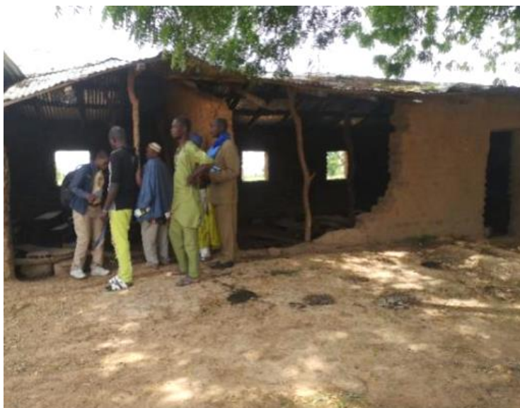
Figure 9 Etat actuel du bloc en banco construit par la communauté

Cumulée à l' absence de latrines , cette situation engendre des conséquences néfastes sur la santé et l'hygiène des enfants et enseignants, sur le maintien de la propreté des infrastructures et sur la capacité à réduire les risques de maladies liées à l'eau . Sans latrines, les enfants sont amenés à manquer une partie de leurs classes pour utiliser les latrines familiales, celles des maisons voisines de l'école, ou encore, à déféquer à l'air libre. La défécation à l'air libre est un phénomène qui pose de sérieux problèmes pour la sécurité des enfants d'une part, mais également